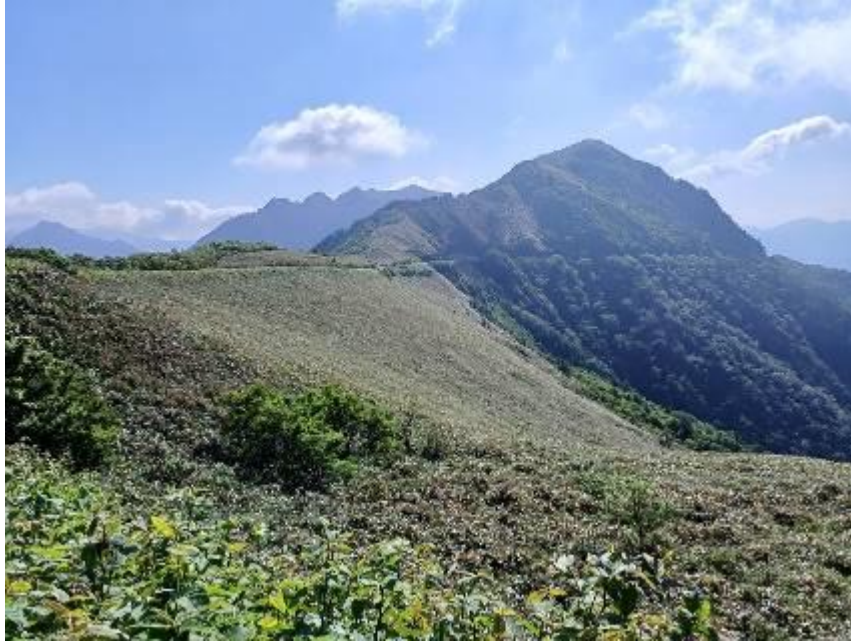
・ UFOラインより東黒森、その奥に伊予富士

いつもながら UFOラインの眺めはいいですね。前に後ろに石鎚山系の山々が眺められます。1時間ほどで伊予富士登山口到着、ここから登るのは初めてですが登りだしてすぐ水場があり、暑いこの時期は助かります。