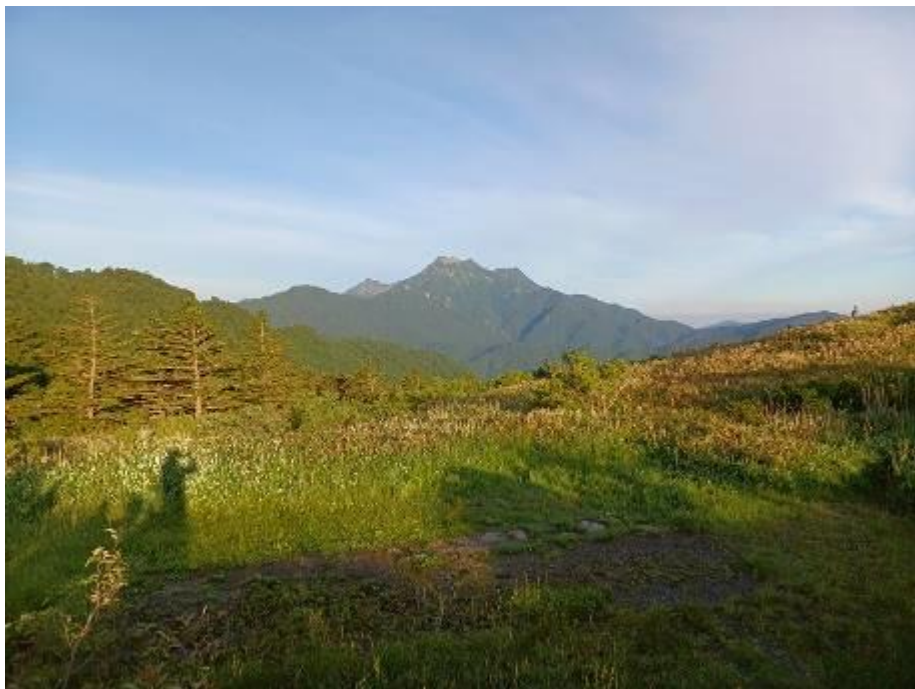
・シラサ峠より朝の石鎚山を拝む

いつものようにキャンプ場ではビールと焚き火を十分楽しんで次の日を迎えます。夏至前のこの時期、朝は4時を過ぎた辺りから明るくなってきます。早々に片付け今日の目的地に向かいます。