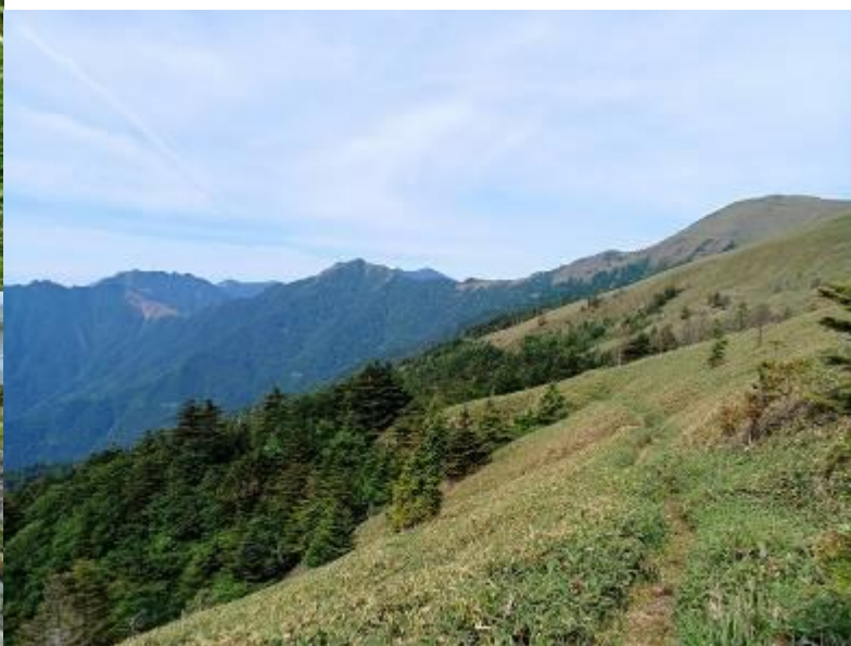
・一ノ谷分岐辺りから笹ヶ峰、寒風山、伊予富士

一ノ谷分岐までの登りは意外と歩き易く（登りはそこそこ有ります）水場も上の方までであり良いコースで、夏に歩いても良さそうです。分岐から「ちち山」向けて登りだすと右手に赤石山系が、左手に石鎚山系の山並が見えだし、ここも最高のコースです。(残念、ここで携帯の電池が切れ映像が無くなってしまいました。)