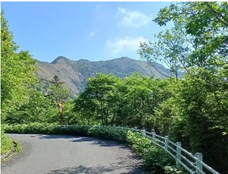
・ UFOラインより伊予富士方面

いつもながら UFOラインの眺めはいいですね。前に後ろに石鎚山系の山々が眺められます。1時間ほどで伊予富士登山口到着、ここから登るのは初めてですが登りだしてすぐ水場があり、暑いこの時期は助かります。