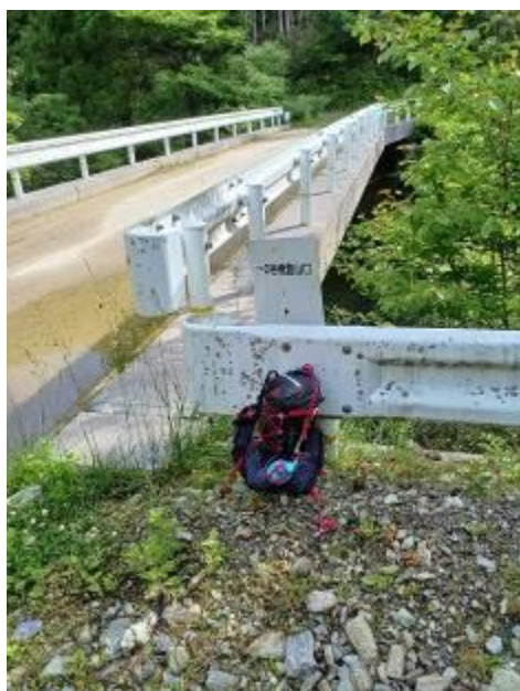
・一の谷橋登山口

シラサ峠で朝の石鎚山を拝み寒風山トンネル南口まで移動、ここから一の谷橋登山口まで林道を走ります。(ここも走りは下りだけ)