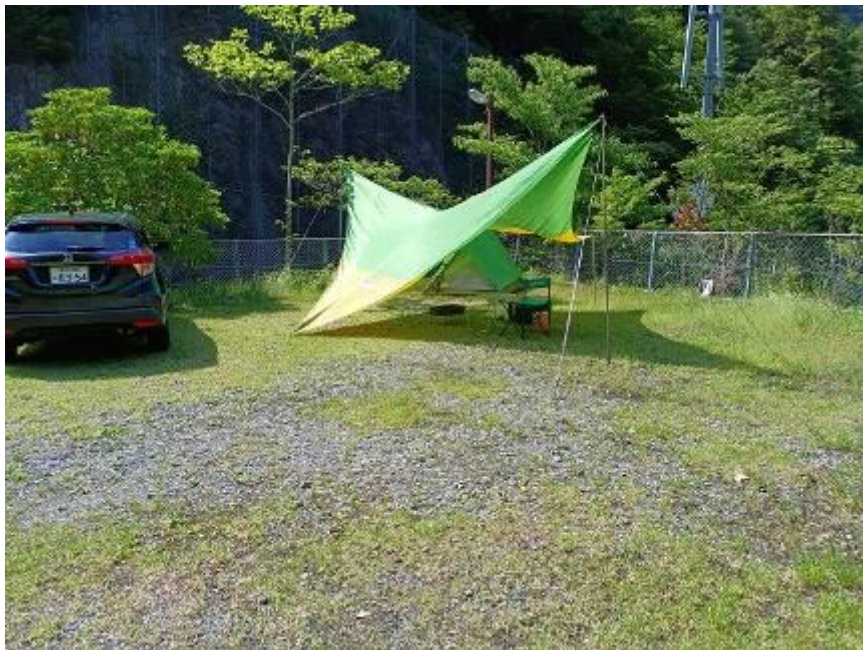
・白猪谷キャンプ場設営風景

駐車場まで帰り今夜の寝場所を考えます。天気はそこそこ良いのですが天候不順なこの頃、夜になって雷でも鳴り出してはと、安全策を取ってふもとの「白猪谷キャンプ場」に下りることにしました。途中でシラサ峠周辺を散策し、それでも3時前にはキャンプ場到着です。