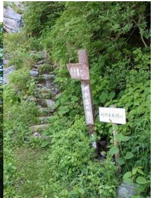
・ 伊予富士登山口

まだ早いのか伊予富士頂上には登山者が誰もいません。平日のこの時間帯はこんなものでしょうか？ 頂上からは西には今日の目的地「瓶ヶ森」まで、東には明日走る「笹ヶ峰、寒風山」など石鎚山系の山々が見事に見渡せます。天気予報を睨んだ甲斐が有ったようです。