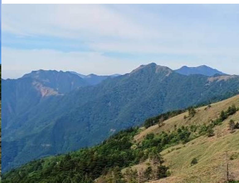
・左より伊予富士、寒風山、瓶ヶ森