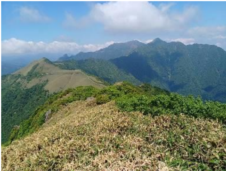
・瓶ヶ森方面の山並