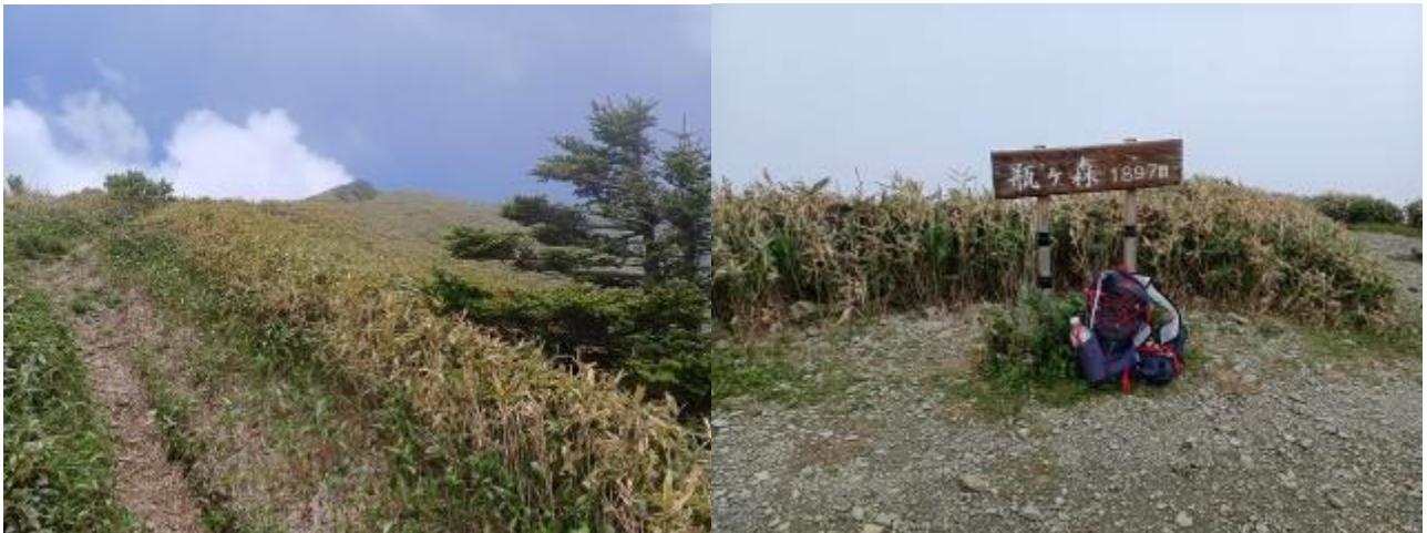
・瓶ヶ森への登りと頂上

今日はどこも登山者が少ないようで瓶ヶ森頂上でも愛媛側（東之川）から登ってこられた女性一人に会っただけです。ちなみに愛媛側から登ったことは無いのですが何処から登っても1300mくらいの登りはありそうですね。一度チャレンジしてみたいことです。